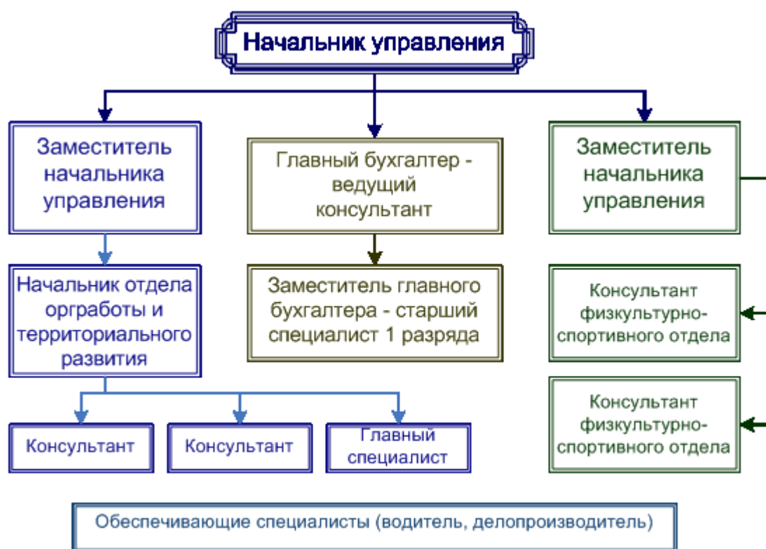
Рисунок 1.1 Структура управления по физической культуре и спорту Амурской области 11